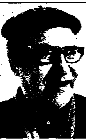
ان طموح الفنان العراقي كبير... وهو يامل بجدته ومثاليته ان يحقق... الاجود