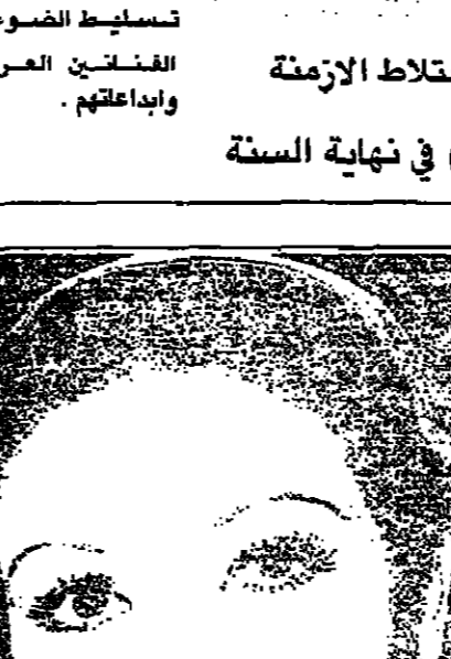
السينمائيين الذين... الذين... الذين...