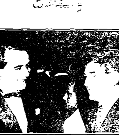
عراق وفنانه... الذي...